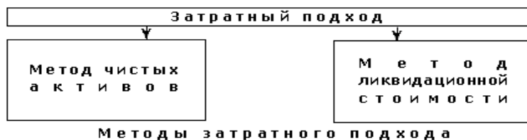
Рис. 2.2. – Методы затратного подхода

Метод дисконтирования денежных потоков основан на прогнозировании потоков от данного бизнеса, которые затем дисконтируются по ставке дисконта, соответствующей требуемой инвестором ставке дохода.