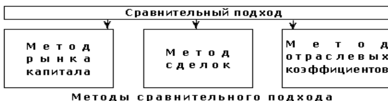
Рис. 2.3. – Методы сравнительного подхода

Ликвидационная стоимость предприятия определяется как разность между суммарной стоимостью всех активов предприятия и затратами на его ликвидацию.